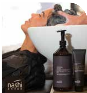
Dialog ved vasken